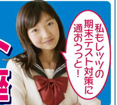
私もレッツの 期末テスト対策に 通おうっと!

一般的に塾では実施が困難な「理科・社会」の対策講座もレッツでは各中学校別に実施しています。基本的にはテスト2週間前から開講します。講座では「新単元の導入→問題演習→解説→復習」のサイクルで進めます。1教科についておおそ6時間~8時間をかけて丁寧に実施します。暗記問題は定着をテストで確認しながら進めますので「やりっぱなし」にはさせません。理・社の成績が今ひとつ伸び悩んでいる方は是非この講座を受講して下さい。 ※お申し込みは先着順です。誠に申し訳ありませんが定員になり次第締め切らせて頂きます