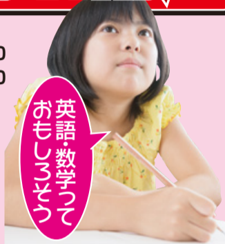
英語数学って おもしろそう

■日時/全12講座(2講座×3日間×2教科) 英語講座:2月6日(火)・13日(火)・20日(火) 各日17:00~18:50 数学講座:2月8日(木)・15日(木)・22日(木) 各日17:00~18:50 ■費用/無料(体験講習の受講初めての方) ■場所/学朋舎レッツ豊田校舎 ■対象/現小学6年生(4月から新中学1年生) 中学での3年間は、自分の将来を決める大切な時期です。この3年間は高校受験、大学受験またその後の将来について真剣に模索し、夢を実現するための進路を探す時期だからです。